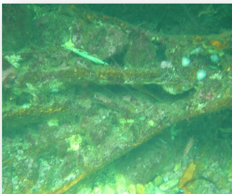
Restos del Submarino