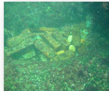
Típica foto del pecio Lingotes de hierro y piezas de cobre y bronce