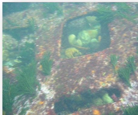
Restos de un tanque de inundación (para poder sumergirse y emerger)