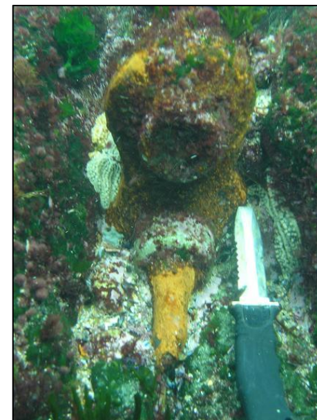
Pieza del “General Mola”