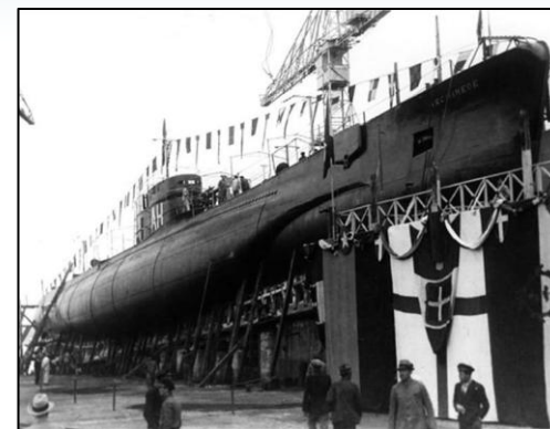
El “Archimede” el día de su botadura.

La isla de Ons pertenece al Parque Nacional de las Islas Atlánticas. Para bucear en la isla hay que pedir permiso, lo mismo para navegar por las aguas de la isla. Que no os tomen el pelo, pedir los permisos es gratuito y sólo hay que cubrir un papel. Por ser un espacio protegido, hay una serie de normas, echadles un vistazo.