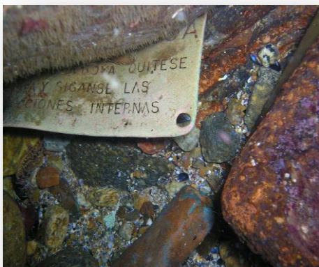
Placa en español